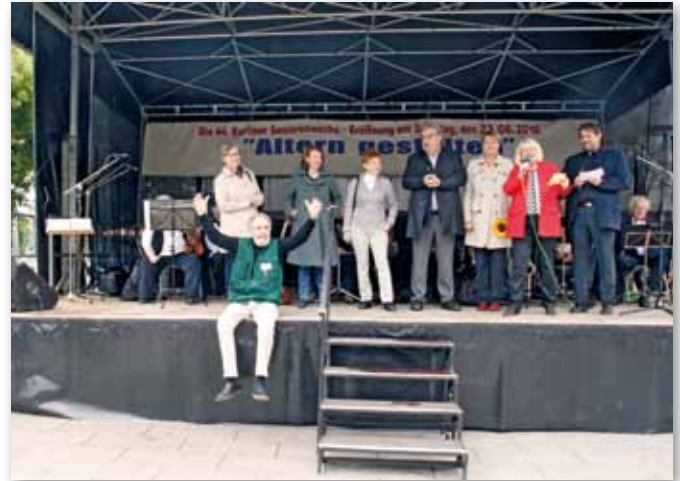
Eröffnung der 44. Senioren Woche 2018