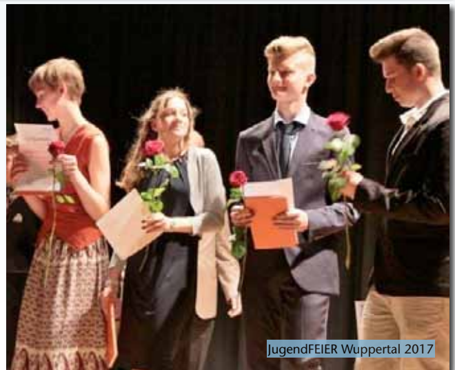
JugendFEIER Wuppertal 2017