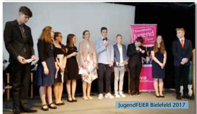
JugendFEIER Bielefeld 2017