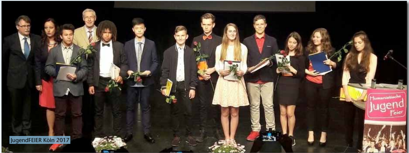
JugendFEIER Köln 2017

Auch 2017 blicken wir auf eine Jugendfeiersaison zurück, die alle Beteiligten, insbesondere die teilnehmenden Jugendlichen und ihre Angehörigen, sehr begeistert hat.