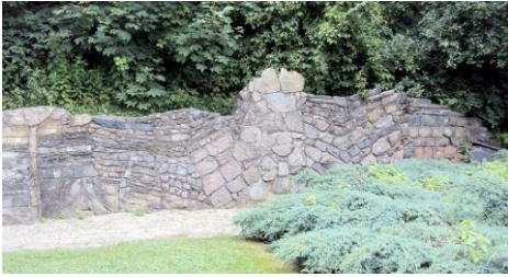
Die geologische Wand aus 123 Gesteinsarten im Volkspark Pankow / Foto: © -wn-

Ziel der naturbegleiter * der Stiftung Naturschutz in Berlin ist es, Menschen aller Altersgruppen zu unterstützen, sich mittels Naturkontakt zu entspannen.