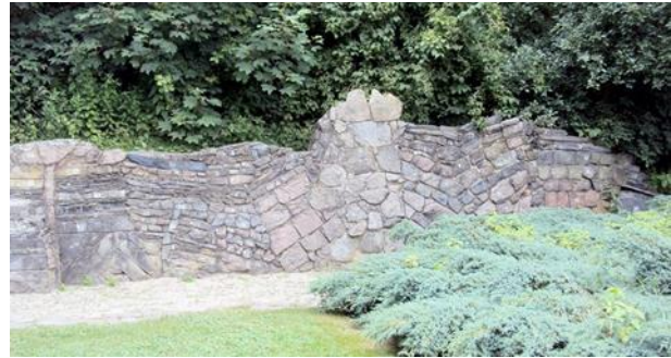
Geologische Wand im Volkspark Pankow

Gemeinsam mit Euren Kindern erhaltet Ihr Impulse, die Stadtnatur neu zu entdecken.